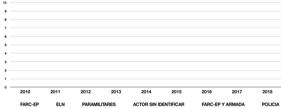
NÚMERO DE CASOS