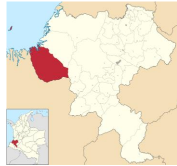
Municipio de Guapi, departamento del Cauca