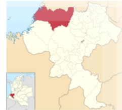
Municipio López de Micay, departamento del Cauca