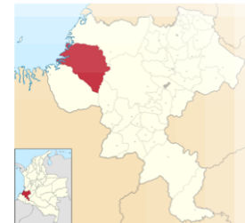
Municipio de Timbiquí, departamento del Cauca