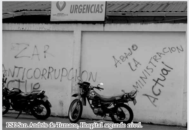
ESE San Andrés de Tumaco, Hospital segundo nivel.

"Pareciera que esta población no hiciera parte del Estado Colombiano, que se muestra ajeno a una problemática tan grave como la que aquí se padece" (habitante Bocas de Satinga)