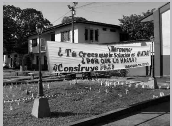
Semana por la Paz, 2009, Parroquia Santa Teresita, Tumaco