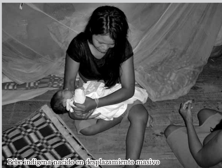
Bébe indígena nacido en desplazamiento masivo

„Frente a mi casa he visto matar a varios ‘niños’ de apenas 18 años que eran sanos. Digo ‘eran’, porque después, por falta de trabajo, se metieron por otros caminos“. (Vecina de un barrio de Tumaco)