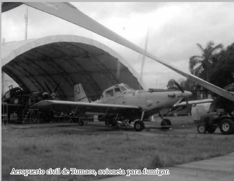
Aeropuerto civil de Tumaco, avioneta para fumigar.