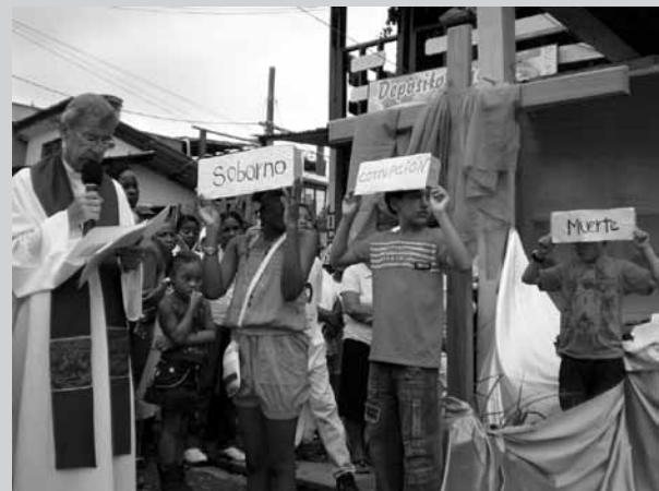
Vía Crucis por la Vida 2010, barrio La Ciudadela