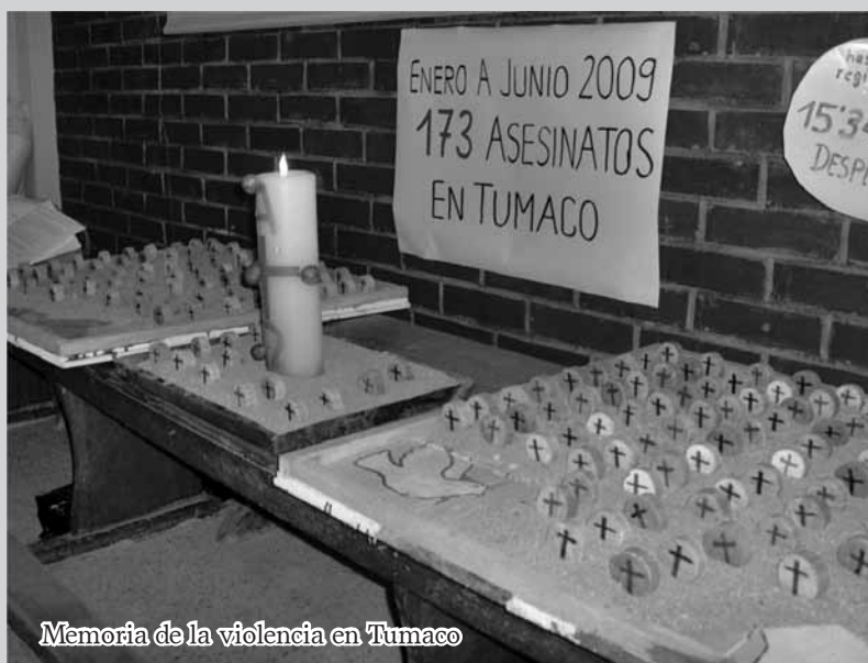
Memoria de la violencia en Tumaco

“A mis 5 hijos los saqué de aquí, pero yo me quedo en mi tierra.” (Lidereza de un barrio de Tumaco)