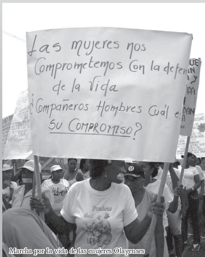
Marcha por la vida de las mujeres Olayenses

(lideranza del municipio de Olaya Herrera, marcha por la vida, 8 de marzo 2010)