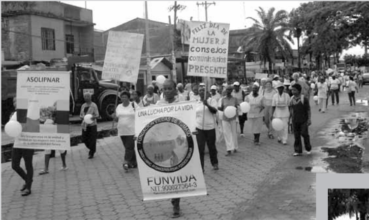
Día Internacional de la Mujer 2010, Tumaco