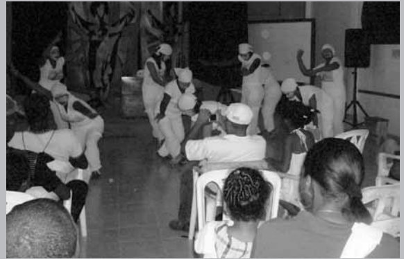
Encuentro de teatro por la paz, 27 de marzo, Día Internacional del Teatro. El grupo de teatro de mujeres "Tumatai" presenta "Como los Santos", Tumaco 2010