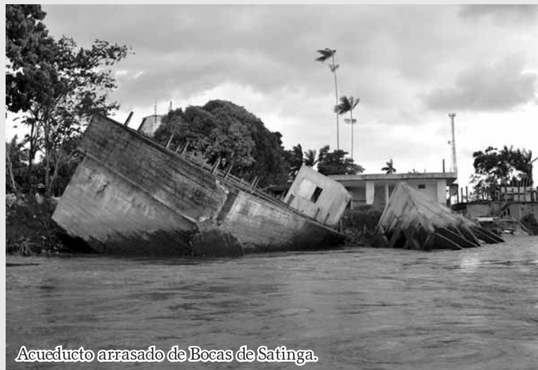
Acueducto arrasado de Bocas de Satinga.

"Si esperamos a que los otros resuelvan nuestros problemas, pueden pasar siglos" (líder afro)