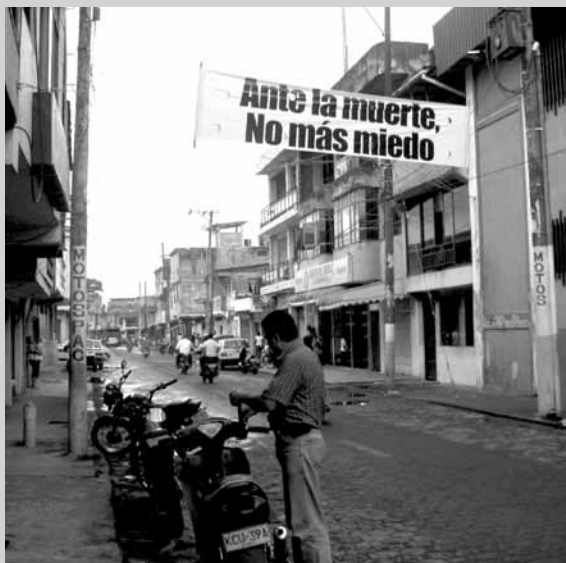
Calle Santander de Tumaco 2010