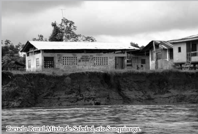
Escuela Rural Mixta de Soledad, río Sanquianga.

"Si esperamos a que los otros resuelvan nuestros problemas, pueden pasar siglos" (líder afro)