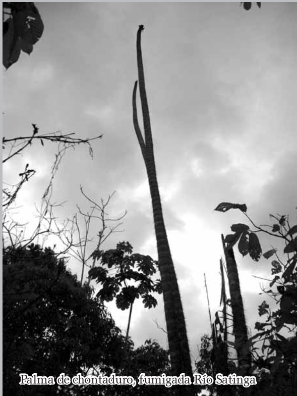
Palma de chontaduro, fumigada Río Satinga

Para destruir una hectárea de coca, en el promedio son afectadas 20 hectáreas de bosque o "pan coger".