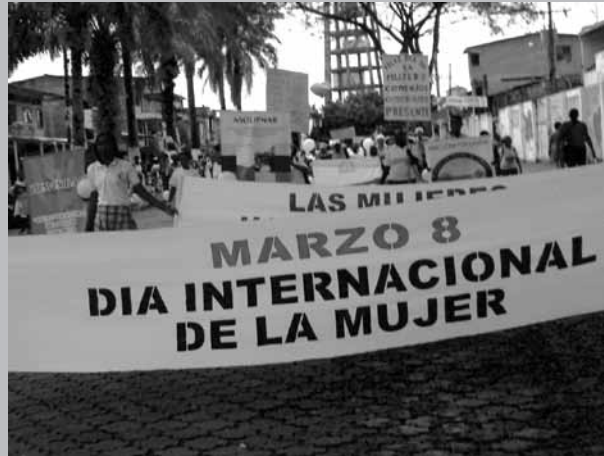
Marcha día internacional de las mujeres, Tumaco 2010