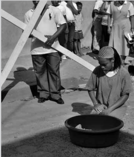
Vía Crucis por la Vida, 2009, Tumaco, tercera estación: Jesús cae por primera vez - la explotación laboral