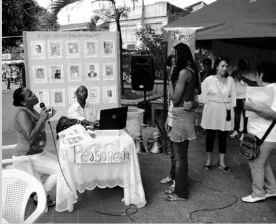
Miembros de la Escuela de Animadores/as Comunitarios/as para la Paz de Tumaco presentan la obra "Hoy por ti, mañana quién sabe" en el espacio de la Galería de la Memoria, Semana por la Paz 2010