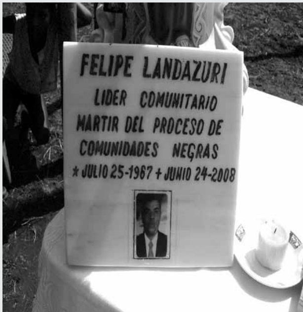
Primer aniversario del asesinato de Felipe Landázuri.

¿Cómo es posible que primero reparen al victimario y a nosotras, las víctimas, nos hacen dar vueltas y vueltas? (familiar de una víctima, Tumaco)