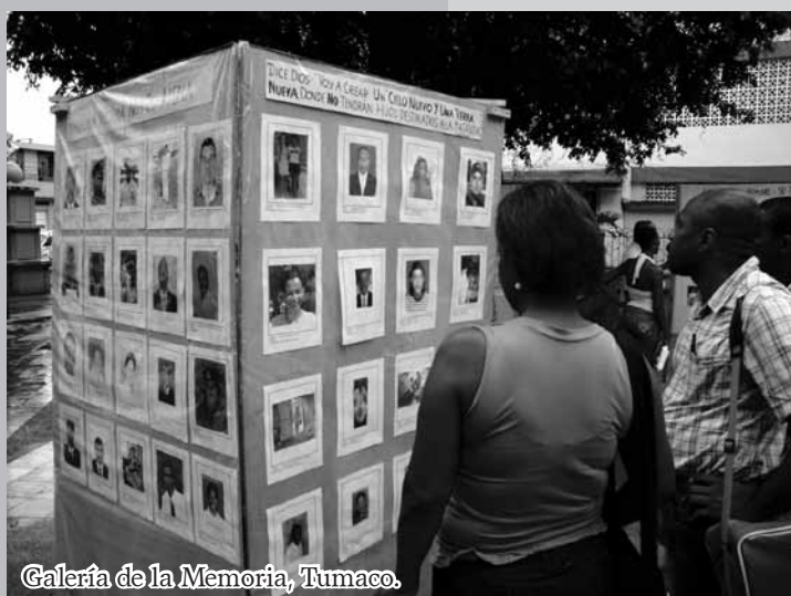
Galería de la Memoria, Tumaco.

„Frente a mi casa he visto matar a varios ‘niños’ de apenas 18 años que eran sanos. Digo ‘eran’, porque después, por falta de trabajo, se metieron por otros caminos“. (Vecina de un barrio de Tumaco)