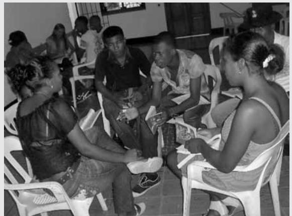
Escuela de jóvenes animadores comunitarios por la paz, 2010