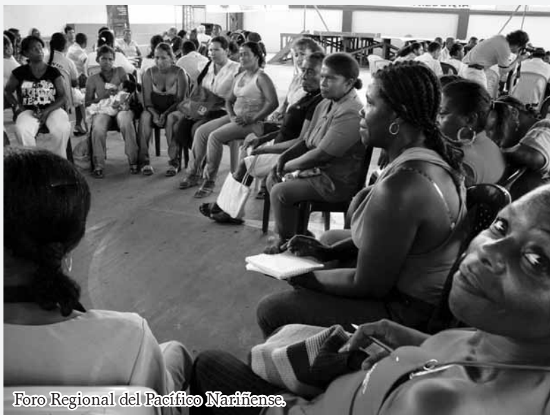
Foro Regional del Pacífico Nariñense.

“El gran desafío es plantearse el plan de manejo del territorio y al lado formular su plan de desarrollo, un plan de desarrollo que realmente recoja las expectativas de las comunidades, que recoja sus aspiraciones y necesidades y que sea hecho por ellas mismas, así como ellas mismas fueron capaces de elaborar su propuesta de titulación. Porque si otros les hacen el desarrollo, nunca habrá el beneficio para las comunidades”.