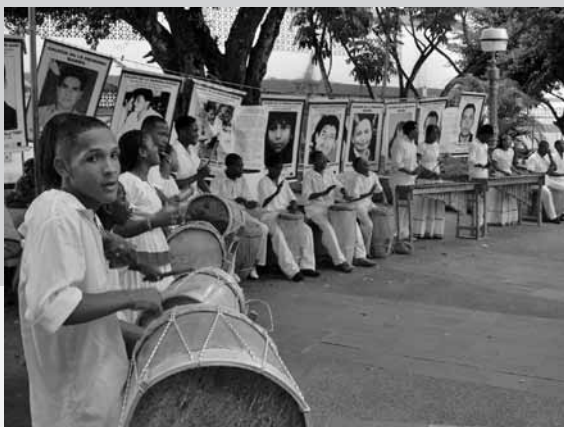
Semana por la Paz 2009, la banda municipal tradicional toca en el espacio de la "Galería de la Memoria", Parque Nariño, Tumaco