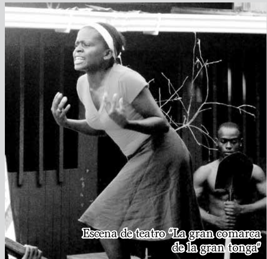
Escena de teatro “La gran comarca de la gran tonga”