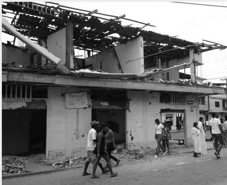
Casa afectada por la bomba colocada a la estación de policía de Tumaco, 1 de Febrero del 2012

"Más bombas les vamos a lanzar" (FARC - EP)