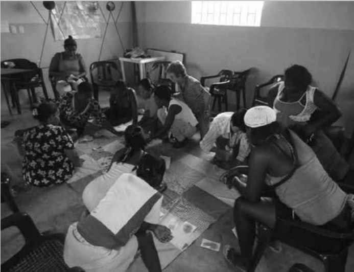
"Mujeres tejiendo la vida", elaborando una colcha de la memoria de sus seres queridos asesinados, agosto 2011.