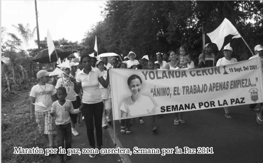
Maratón por la paz, zona carretera, Semana por la Paz 2011

"Vamos a pegarnos de lo bueno que aún tenemos, de la semilla que nos queda".