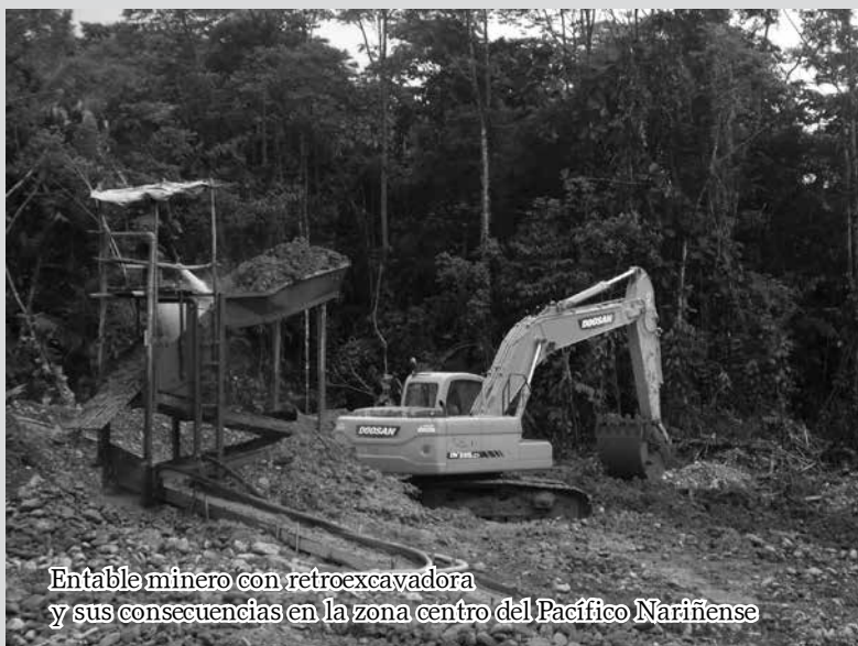
Entable minero con retroexcavadora y sus consecuencias en la zona centro del Pacífico Nariñense

"El equilibrio de la tierra está en nuestras manos y el futuro de sus hijos también depende de nuestra madre"