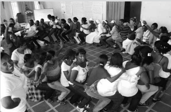
Escuela de formación integral de laicos/as y animadores/as, Zona Norte