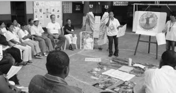
Foro abierto sobre el derecho a verdad, justicia y reparación integral y colectiva, semana por la paz, 19 de septiembre 2011