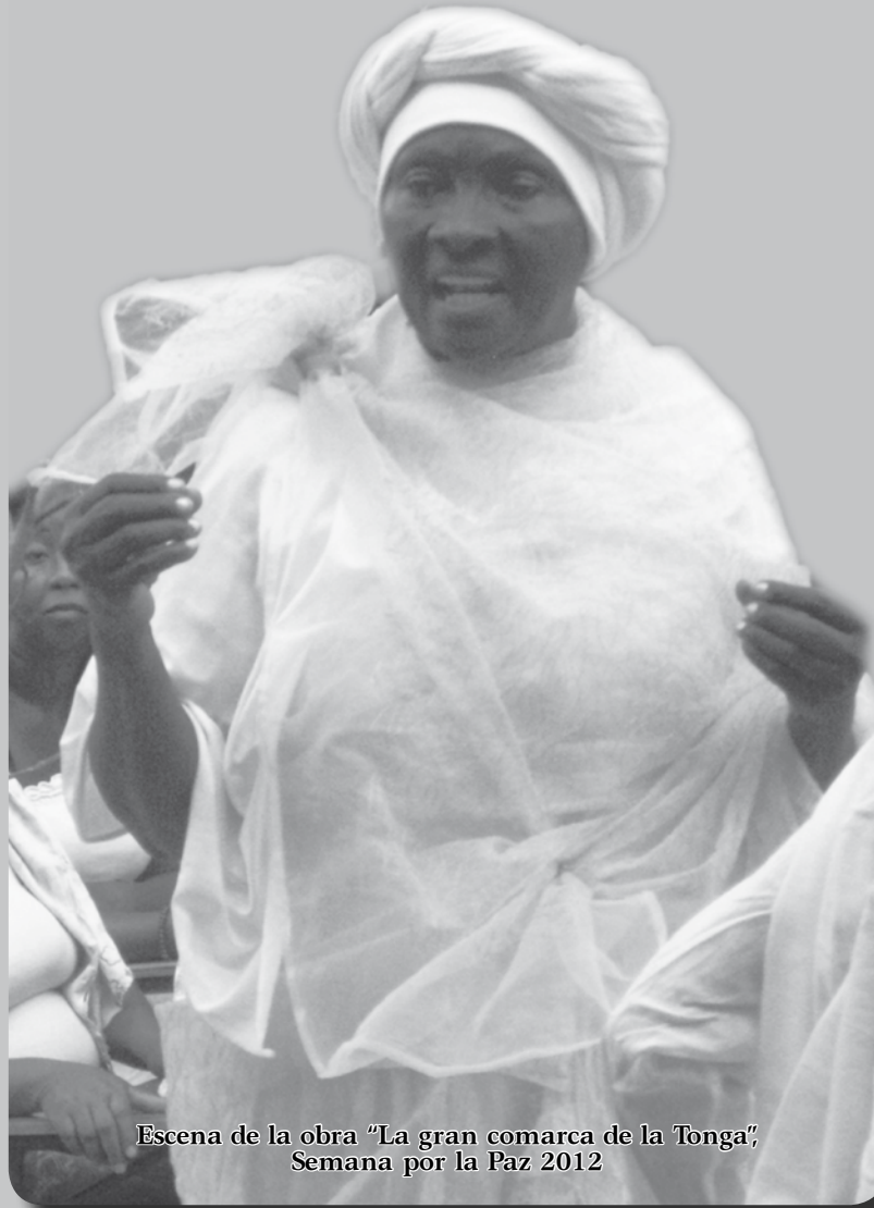
Escena de la obra "La gran comarca de la Tonga", Semana por la Paz 2012