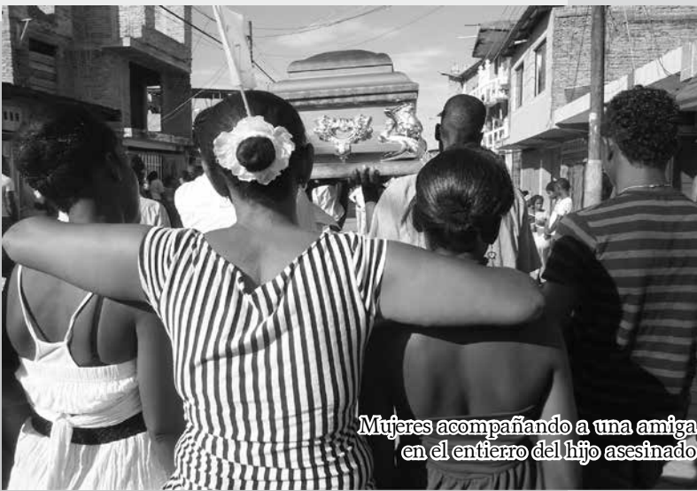
Mujeres acompañando a una amiga en el entierro del hijo asesinado

"Yo necesito que me den manque los huesos de mi hijo"