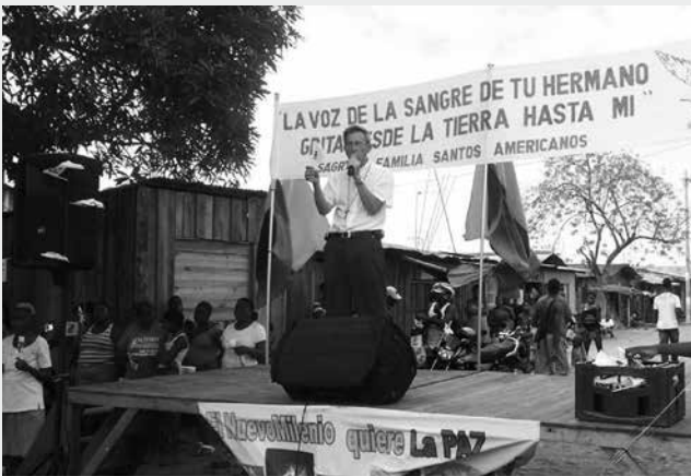
Fiesta de la paz, convocado a raíz del aumento de violencia en el barrio Nuevo Milenio y la estigmatización de sus habitantes, 1 de julio 2012