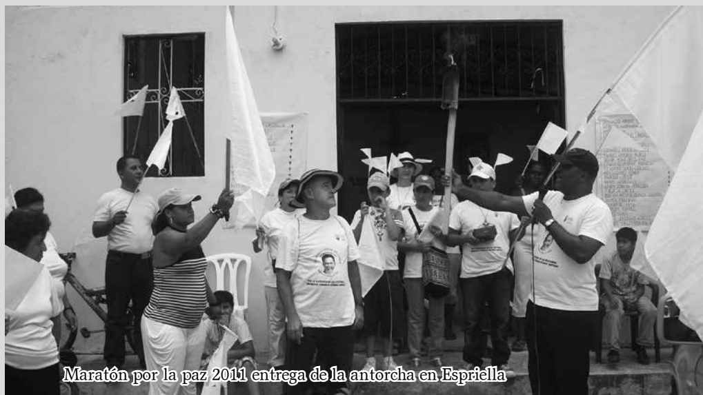
Maratón por la paz 2011 entrega de la antorcha en Espriella