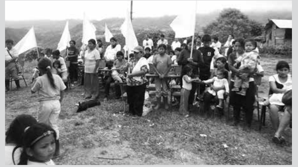
Conmemoración del día internacional de no violencia contra la mujer, 25 de noviembre 2011, barrio Primavera, Altaquer