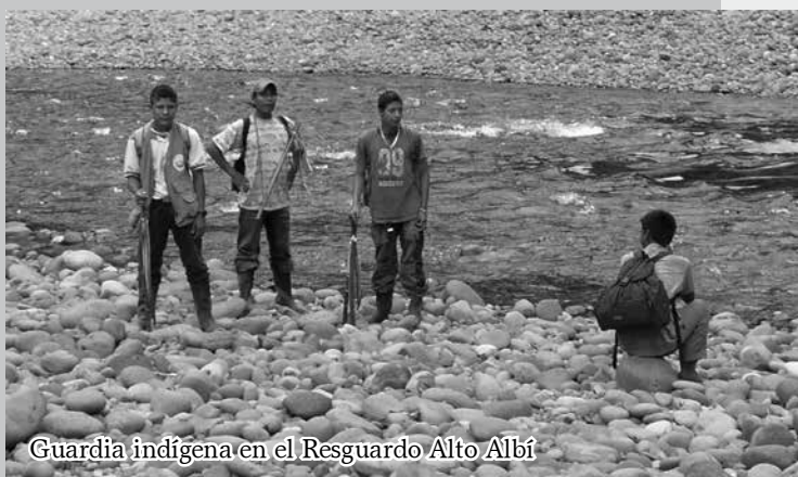
Guardia indígena en el Resguardo Alto Albí

"Nos quieren convertir de dueños a peones"