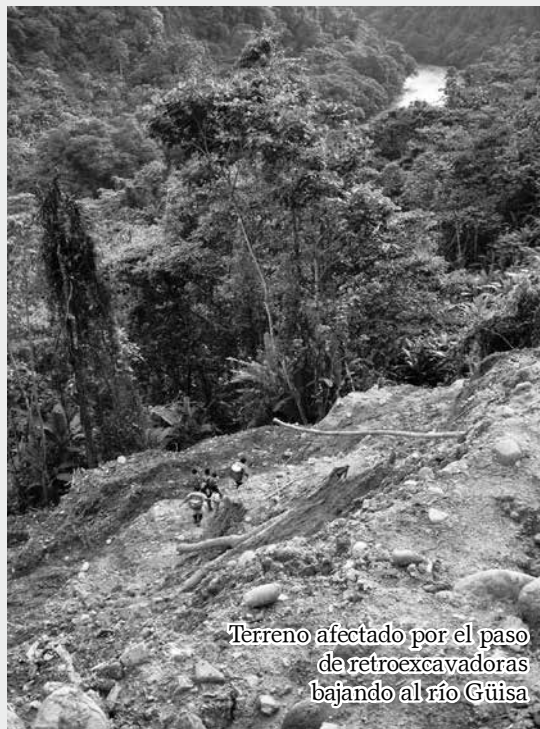
Térreno afectado por el paso de retroexcavadoras bajando al río Güisa

"La minería nos está matando el futuro". (Comunicado UNIPA 16 de abril 2012)