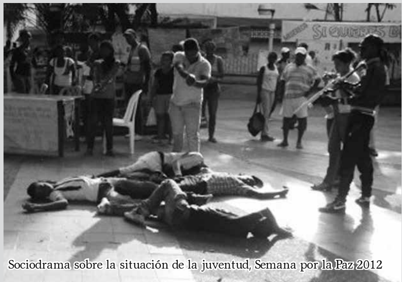
Sociodrama sobre la situación de la juventud, Semana por la Paz 2012