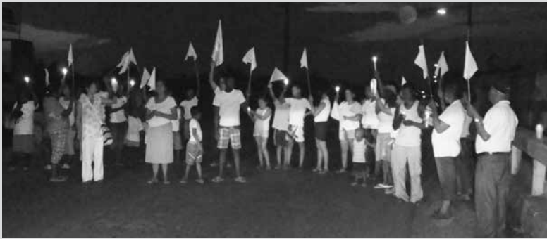
Caminata de silencio y plantón por el respeto a la vida y por la paz: Tangareal (zona carretera del municipio de Tumaco), julio 2012