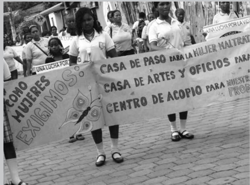
Marcha Día Internacional de la Mujer, 8 de marzo 2011: Expresando las reivindicaciones de las mujeres en Tumaco