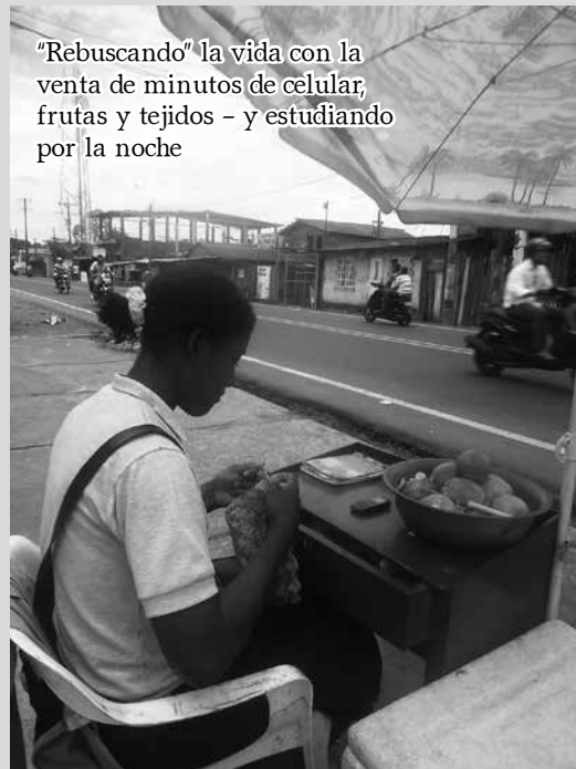
"Rebuscando" la vida con la venta de minutos de celular, frutas y tejidos - y estudiando por la noche

(Palabras de consuelo de una mujer a su vecina que estaba esperando en la morgue de Tumaco, el cadáver de su hijo asesinado)