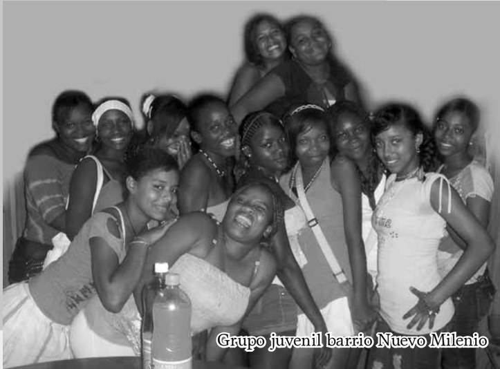
Grupo juvenil barrio Nuevo Milenio

“Los jóvenes quisiéramos hablar de alegría, hacer planes para el futuro, contar sobre los novios o novias, ver televisión si queremos, o salir a