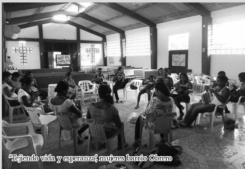
"Tejiendo vida y esperanza" mujeres barrio Obrero