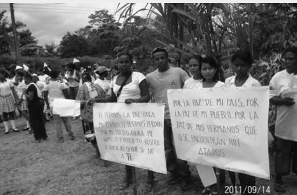
Maratón por la paz, zona carretera, Semana por la Paz 2011