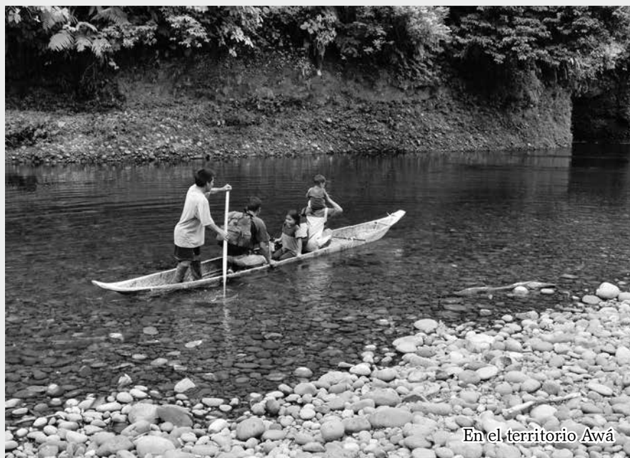
En el territorio Awá

"Nos quieren convertir de dueños a peones"