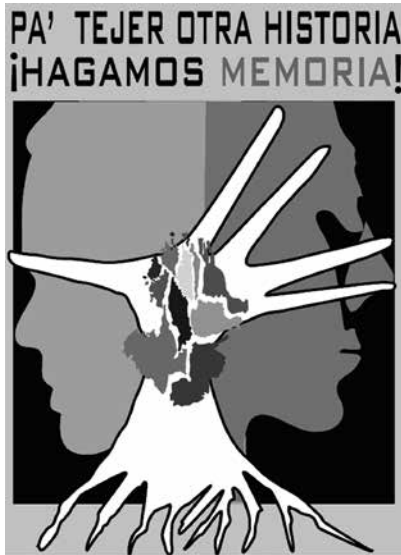
Logo diseñado por Hilma Roa Avellaneda