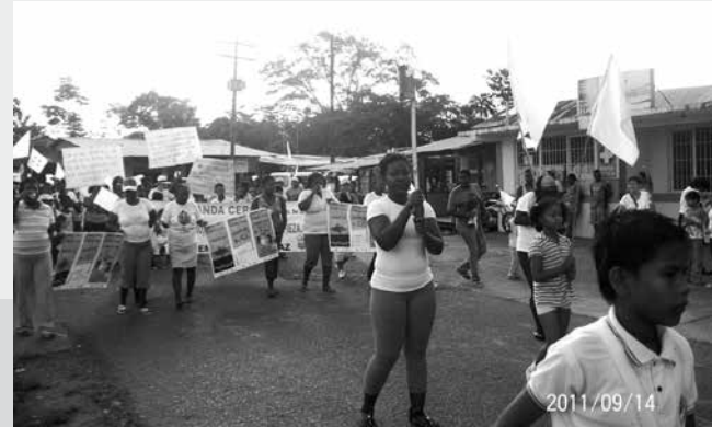
Maratón por la paz, zona carretera, Semana por la Paz 2011