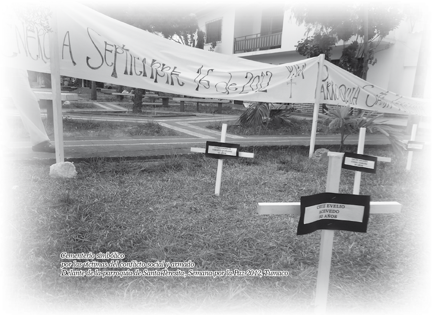
Cementerio simbólico por las víctimas del conflicto social y armado Delante de la parroquia de Santa Teresita, Semana por la Paz 2012, Tumaco