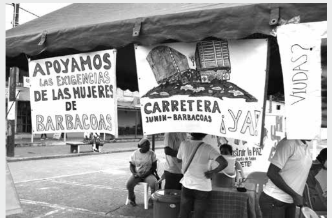
Día de la Mujer, 8 de marzo 2012, solidarizándose en Tumaco con las mujeres del movimiento de piernas cruzadas de Barbacoas