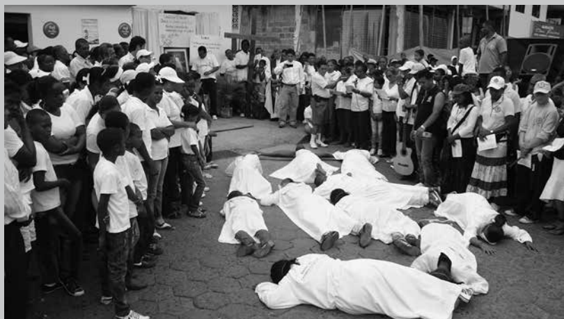
12ª Estación del Vía Crucis por la Vida, sitio del atentado a la estación de policía Tumaco, 1 de Febrero de 2012

"No más armas, sino inversión social y trabajo" (Sociedad Civil)