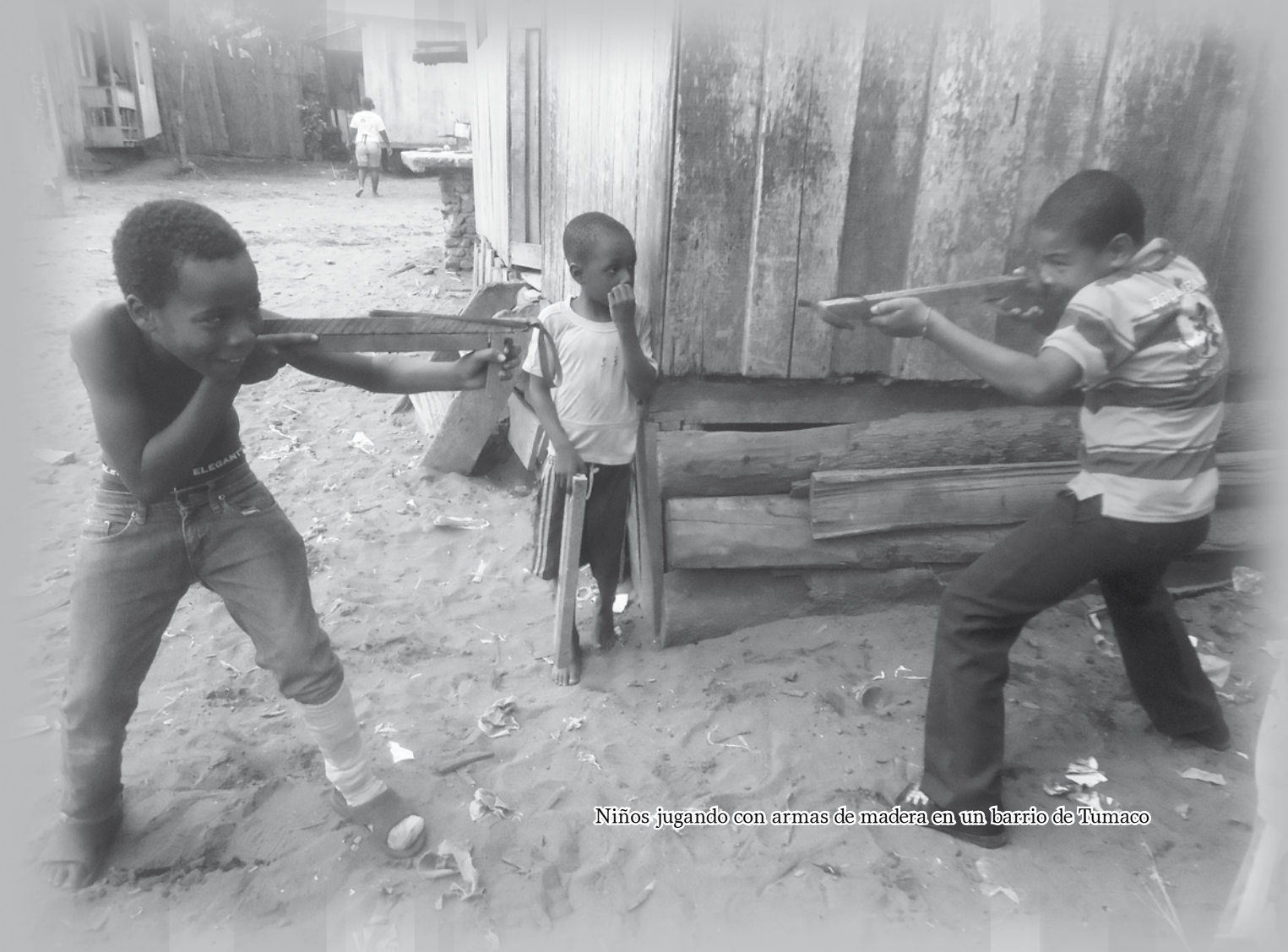
Niños jugando con armas de madera en un barrio de Tumaco

"Hoy los niños y las niñas juegan a la guerra, con armas de madera construidas por ellos mismos y les dan sus nombres: metralla, pistola, recortada, mini uzzi".