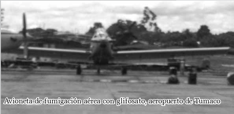
Avioneta de fumigación aérea con glifosato, aeropuerto de Tumaco

¿El objetivo es erradicar coca, o el objetivo es recuperar para el país, para la economía legal, territorios, pero sobre todo seres humanos, que merecen que el Estado les brinde una segunda oportunidad?"