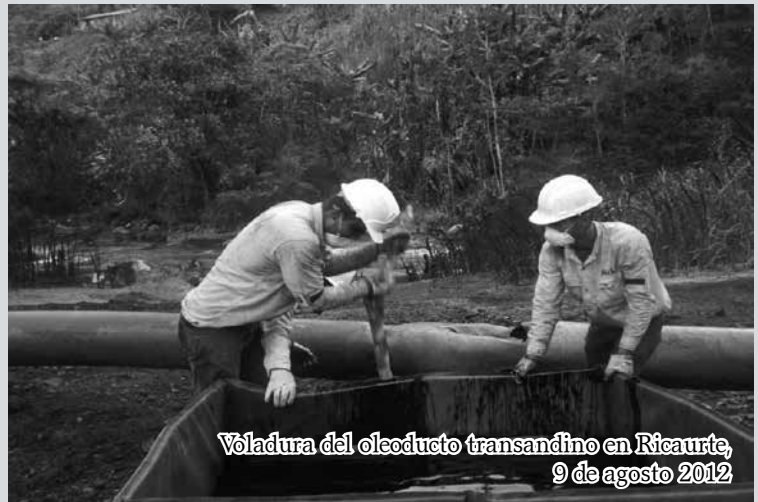
Voladura del oleoducto transandino en Ricaurte, 9 de agosto 2012

(Conferencia Episcopal de Colombia, julio 2012)