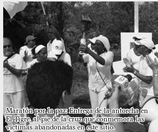
Maratón por la paz: Entrega de la antorcha en El Tigre, al pie de la cruz que conmemora las víctimas abandonadas en este sitio.

(Gestora Social municipio de Tumaco, en el simposio por la paz, julio 19 de 2012)