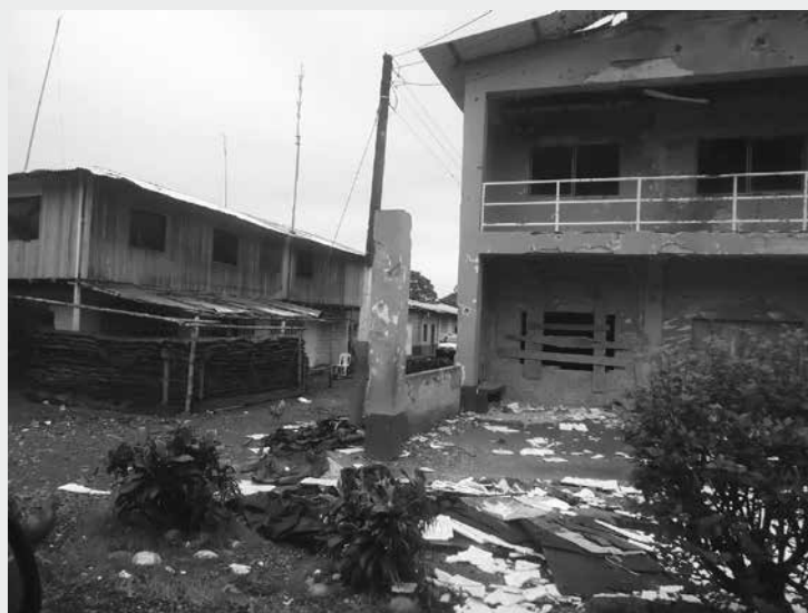
Institución Educativa afectada por el ataque de las FARC - EP al puesto de policía de Chilví, 2 de junio de 2012

(Coronel Carlos Castillo, comandante de la Cuarta Brigada de Infantería de Marina, en un consejo extraordinario de seguridad, junio 2012)